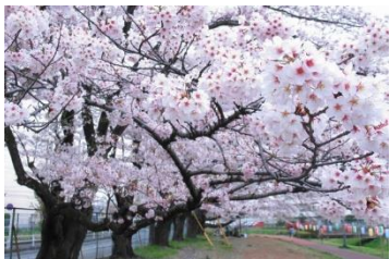
しんやま親水広場