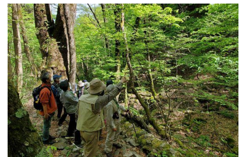
2022年5月 三頭山（都民の森）