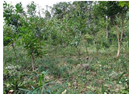
伐採後3-4年でこのような若い林となりました。この後の林の生長が楽しみです。