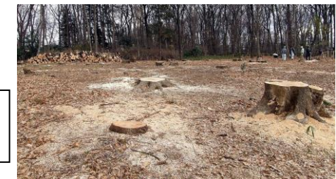
一旦すべて の木を伐採