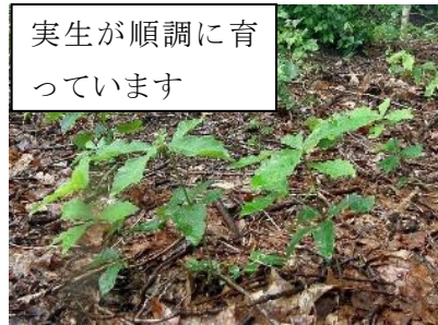
実生が順調に育っています