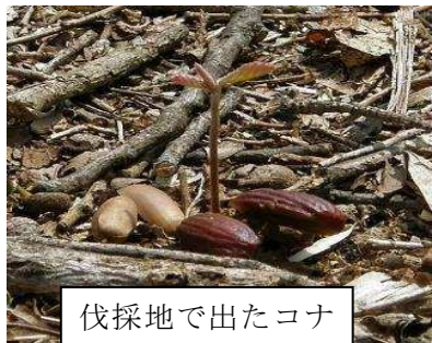
伐採地が出たコナラの新芽（実生）