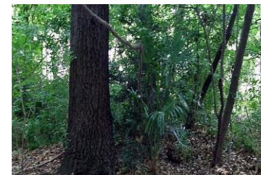
伐採前の 暗い林床

林を若返らせてよい状態で将来に引き継ぐため、2009年1月に1期区450㎡、2010年1月に2期区1000㎡を伐採しました。切り株から出た芽（萌芽）や種から出た芽（実生）を育てて新しい林を目指しています。林床では日あたりが良くなり眠っていた多くの草花が芽を出し、林の他の部分に比べ豊かな植生となりました。林が育っていく様を見守ってください。更新区内を通る観察路を設置しました。