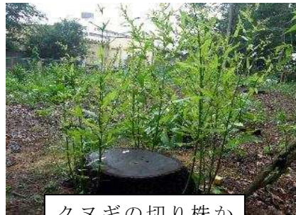
クヌギの切り株から出た新芽（萌芽）