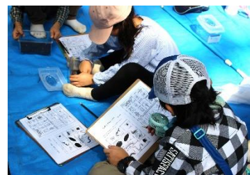
昆虫の観察・分類